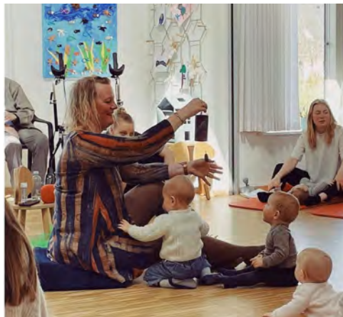
Babysalmesangen foregår nogle gange på Hornbækhave, som her, hvor børn og ældre har glæde af hinanden.